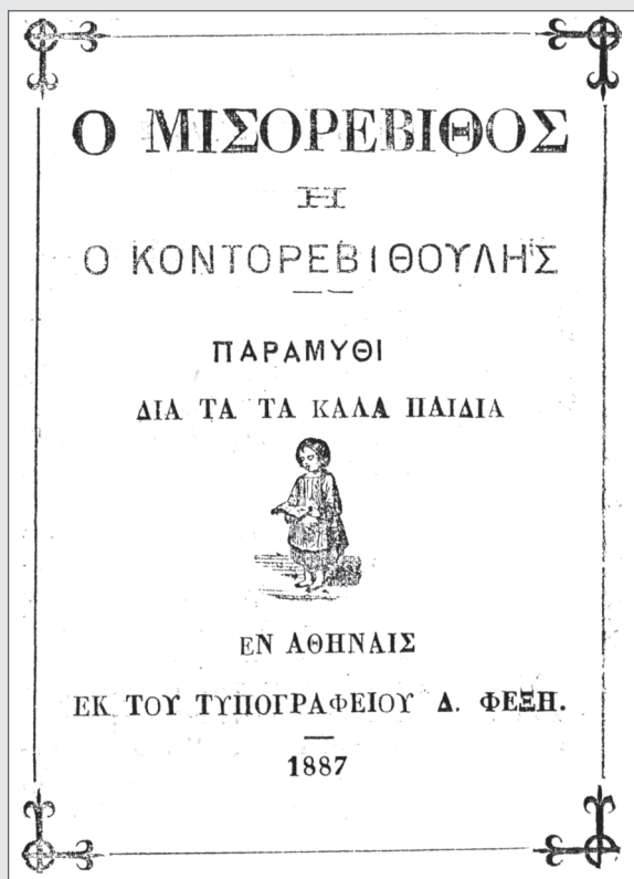
Εικ. 1 Εξώφυλλο φυλλαδίου με παραμύθια από τη συλλογή του Νικολάου Γ. Πολίτη, το οποίο περιέχει μία από τις πρώτες μεταφράσεις του γνωστού Κοντορεβιθούλη στην Ελλάδα.